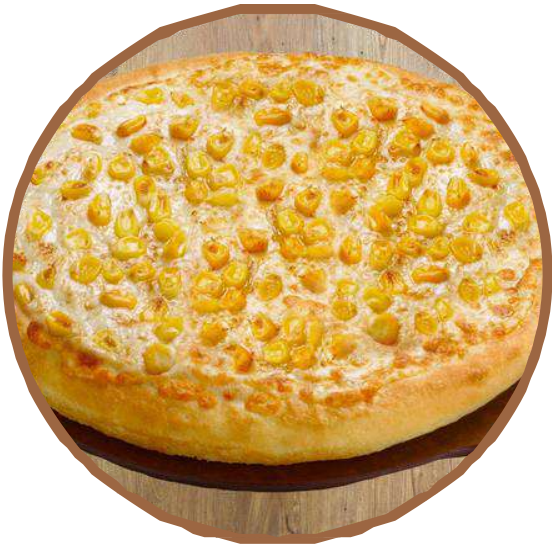
コーン ・ Corn ذرة حلوة