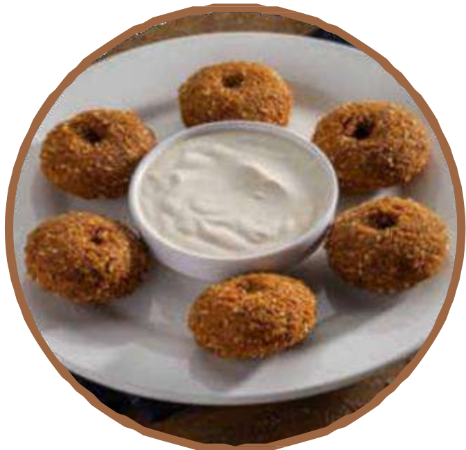
Falafel ファラフェル 3コ فلافل