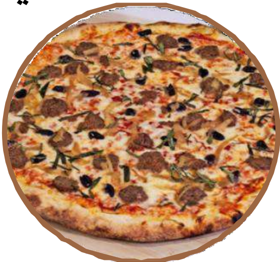
ビーフケバブ Beef Kebab