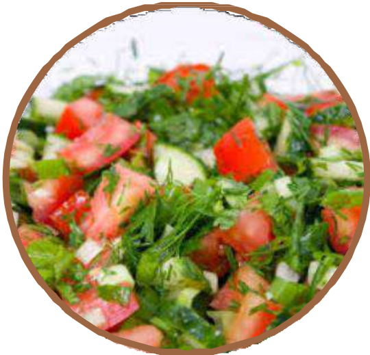
Arabian Style salad アラビア風サラダ