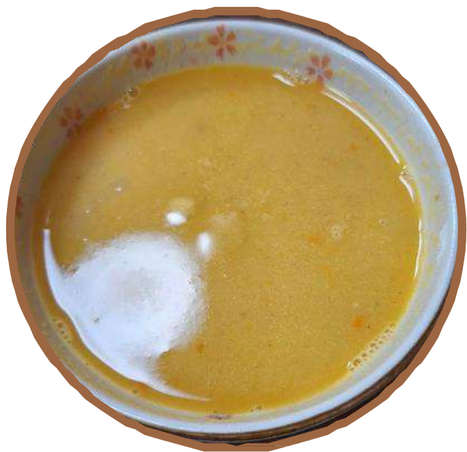
Lentil Soup レンズ豆のスープ شوربة عدس