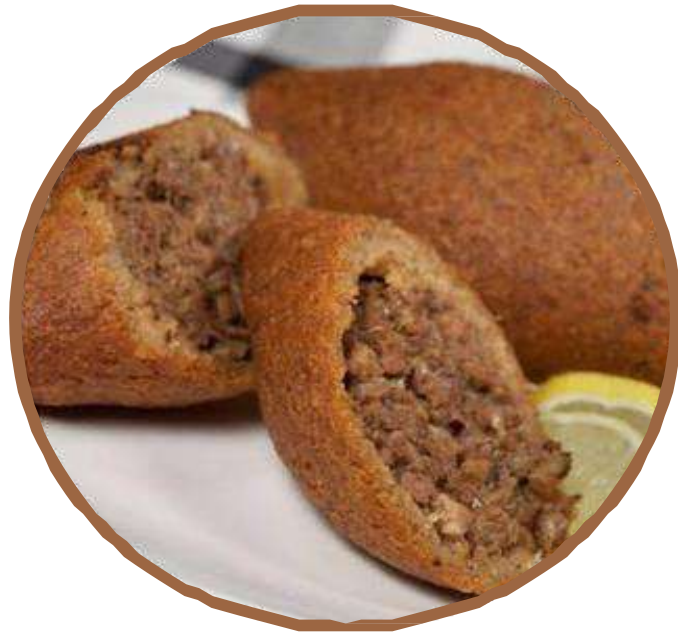
كبة ケツバ 3コ Kebba