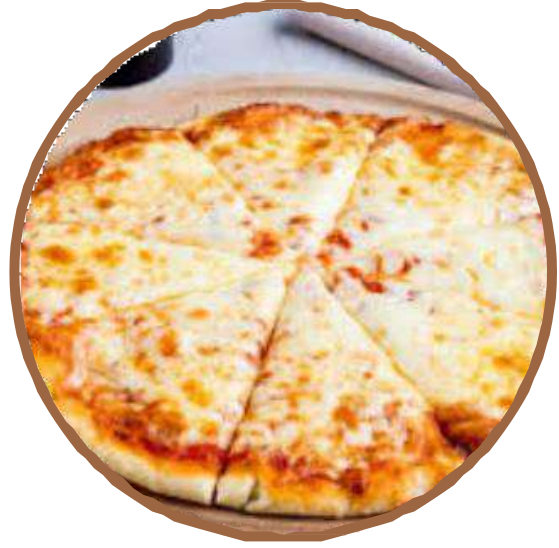
チーズ ・ Cheese جبنة