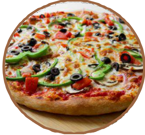
野菜 ・ Vegetable خضار