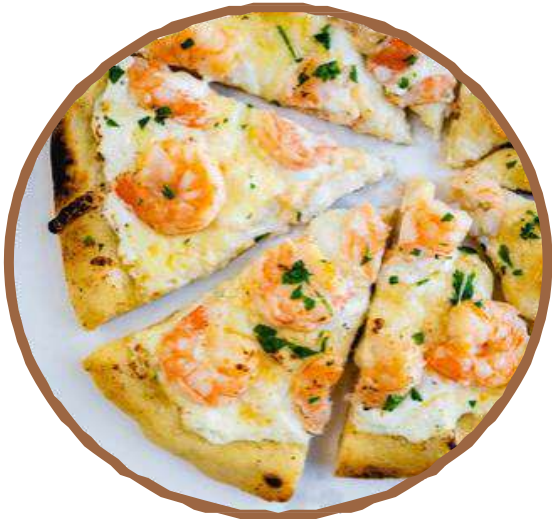
シュリンプ ・ Shrimp جمبري