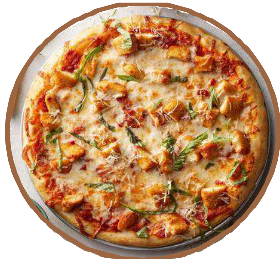
シキンケバブ Chicken Kebab